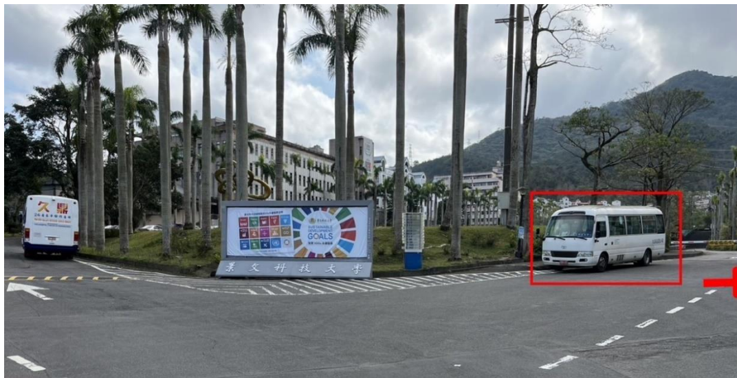
景文科技大學免費接駁車班次時間表